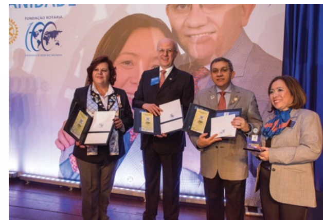
Distrito 4420 e Fundação Rotária oficializam selo e carimbo comemorativos ao centenário

O EGD conta que, depois que amadureceram a ideia, também visualizaram uma forma de atingir positivamente todos os rotarianos. Segundo ele, as peças lançadas formam um kit personalizado para várias situações. “O carimbo é de uso exclusivo dos Correios, mas o selo e o envelope servem para qualquer pessoa, empresa ou clube circular em suas postagens de forma diferenciada. Além disso, presta homenagem ao centenário e amplia as formas de imagem pública. Com isso, todos os clubes do Distrito passam a ter mais uma ferramenta para arrecadar recursos à instituição. Cada selo ou conjunto de envelopes que adquiridos serão depositados em nome dos clubes na Fundação Rotária”.