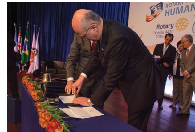
Curador da Fundação Rotária utiliza o carimbo oficial pela primeira vez na cerimonial de lançamento