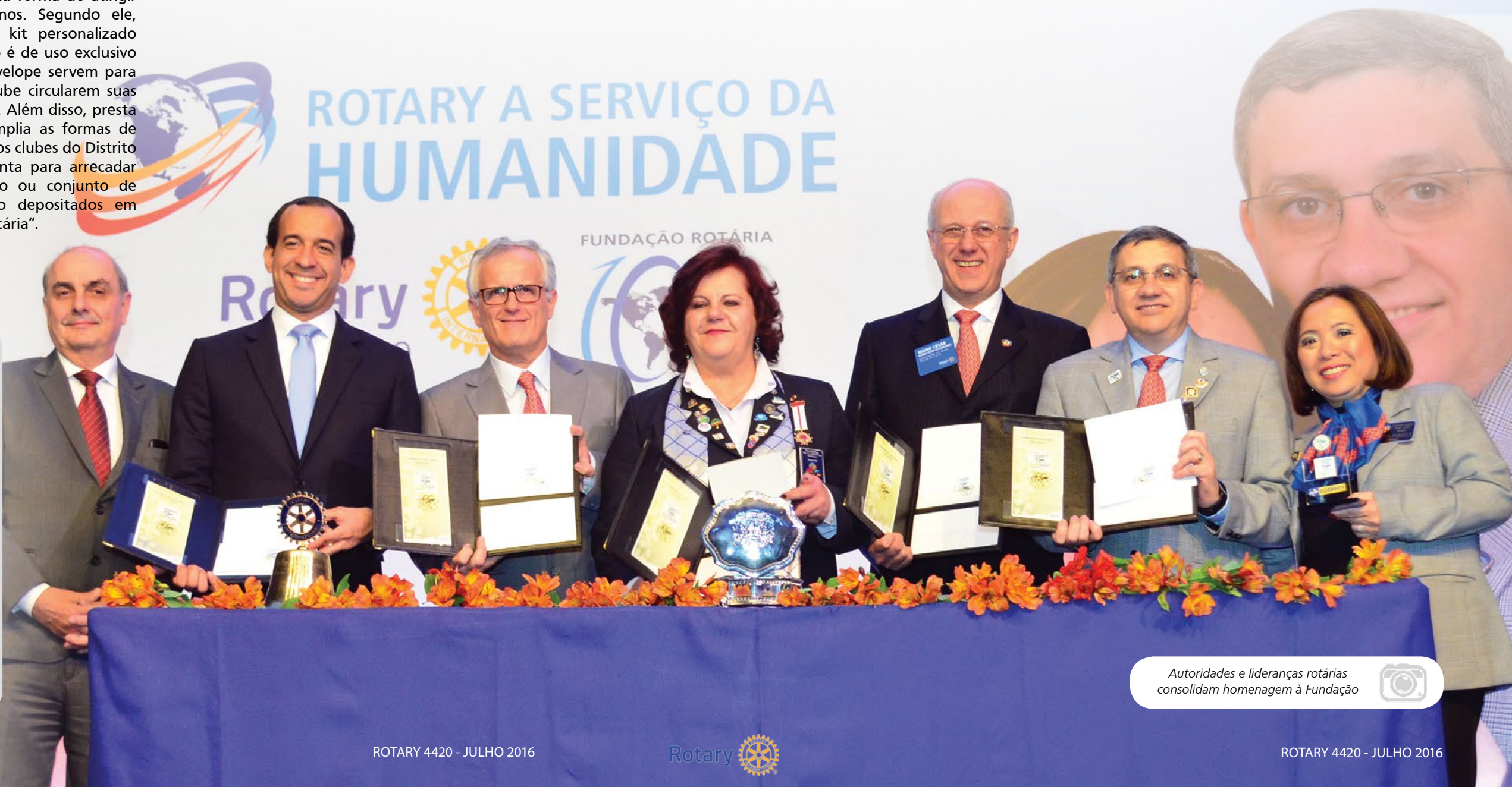
Autoridades e lideranças rotárias consolidam homenagem à Fundação